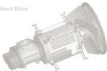
Albert Direct Drive